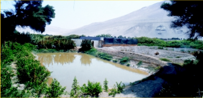
Crianza de camarones en granja

Así, se espera ofrecer una nueva alternativa productiva para la zona, que incluye el desarrollo del sistema de crianza (hatchery) para la producción de juveniles y la posterior engorda de los ejemplares en los predios de los propios productores, para su posterior comercialización.